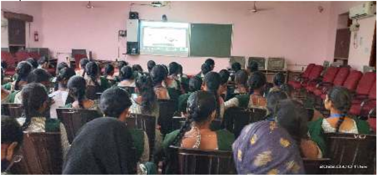
Students of KVR GCW (A), Kurnool attended Mind Map Training Programme i.e Insurance Batch