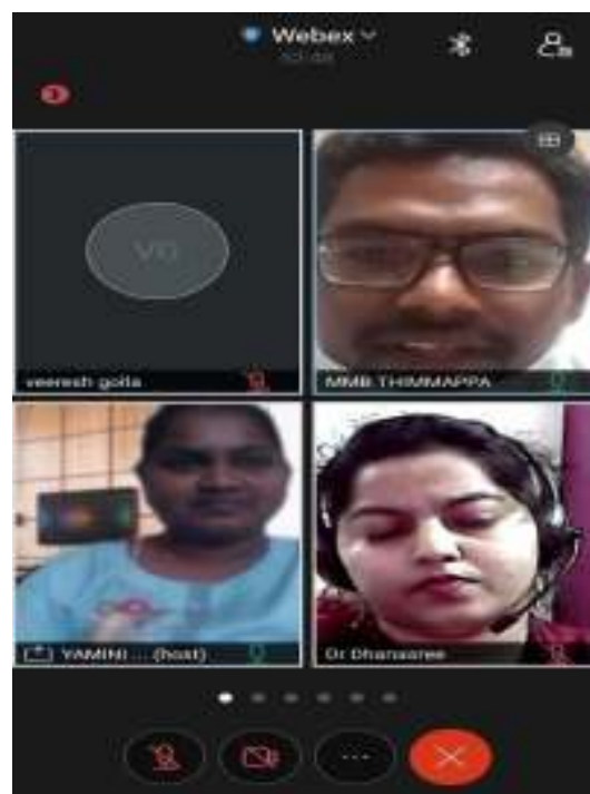
HRs , ICICI & JKC Coordinator, KVR GCW (A), Kurnool attended for Job Drive