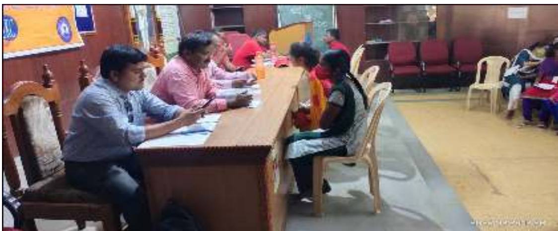
Interviews to the Students