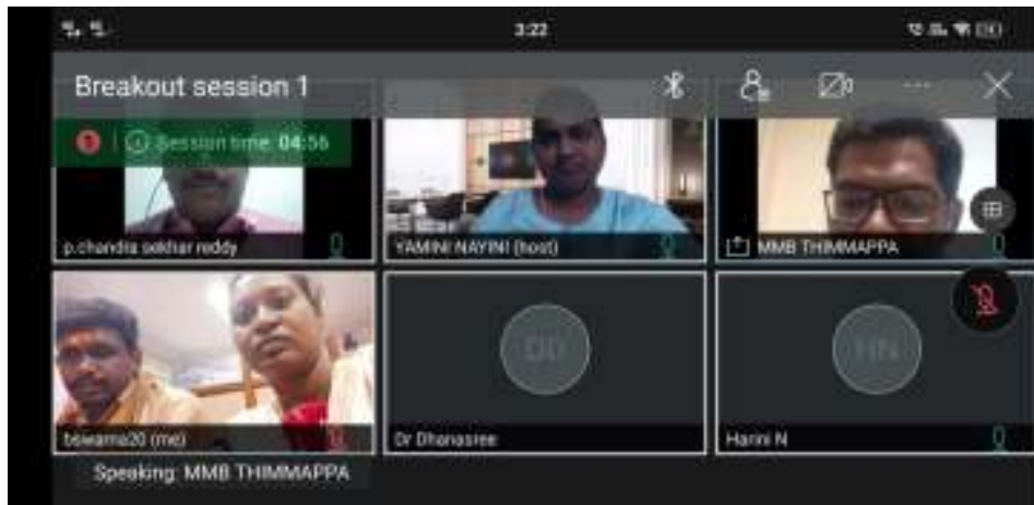
HRs , ICICI & JKC Coordinator, KVR GCW (A), Kurnool attended for Job Drive