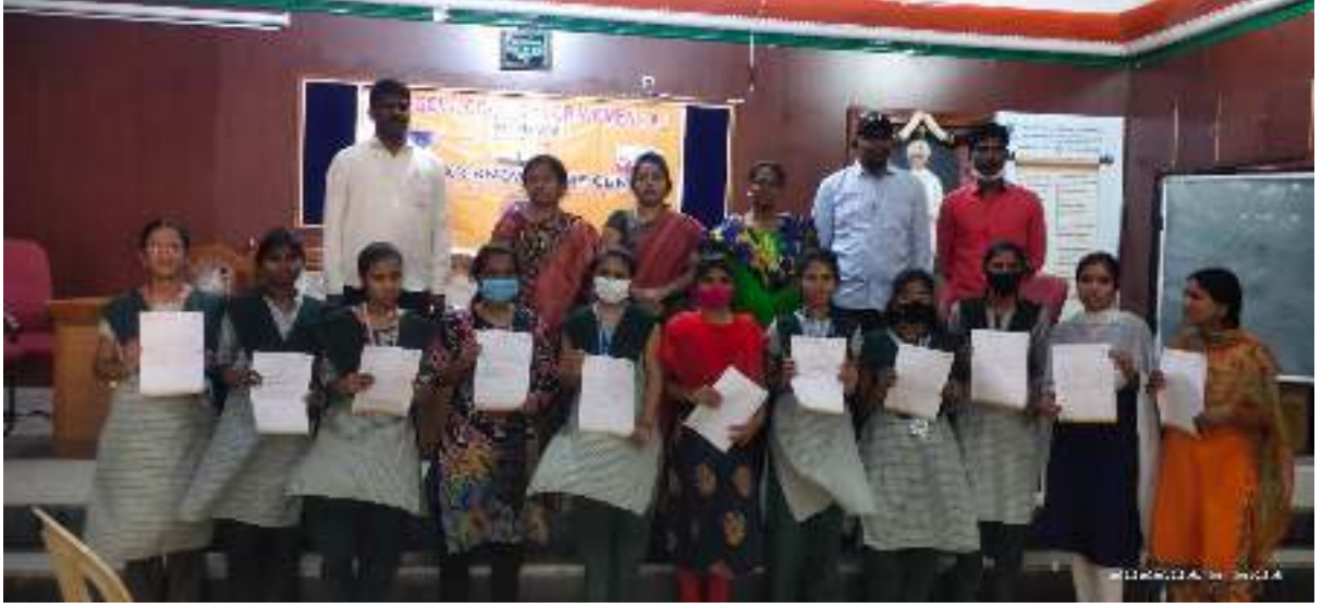
Selected Students of KVR GCW(A), Kurnool for RSMIPL, Sricity