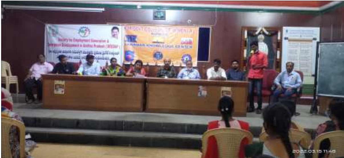
Speech by Company HR, RSMIPL, Sricity