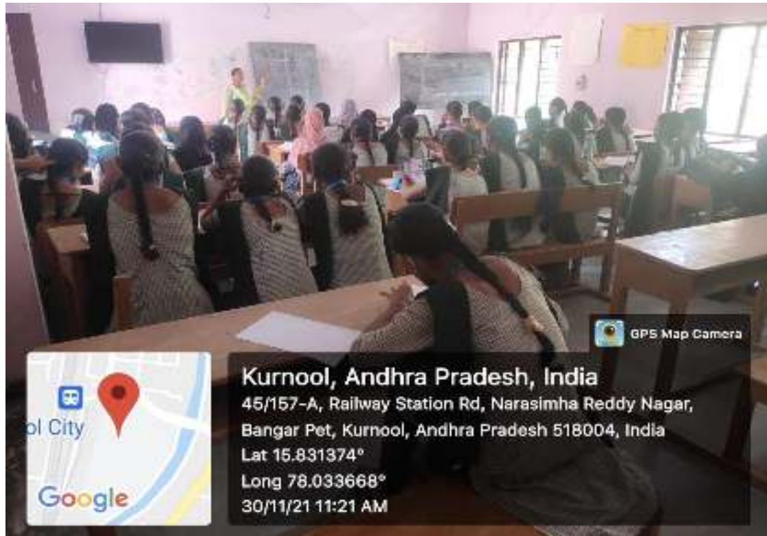
Analytical Skills class by B.Swarnalatha, JKC FTM, KVR GCW (A), Kurnool