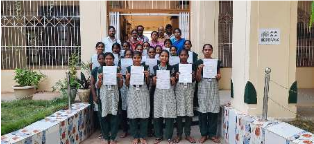
Infosys final shortlisted Students