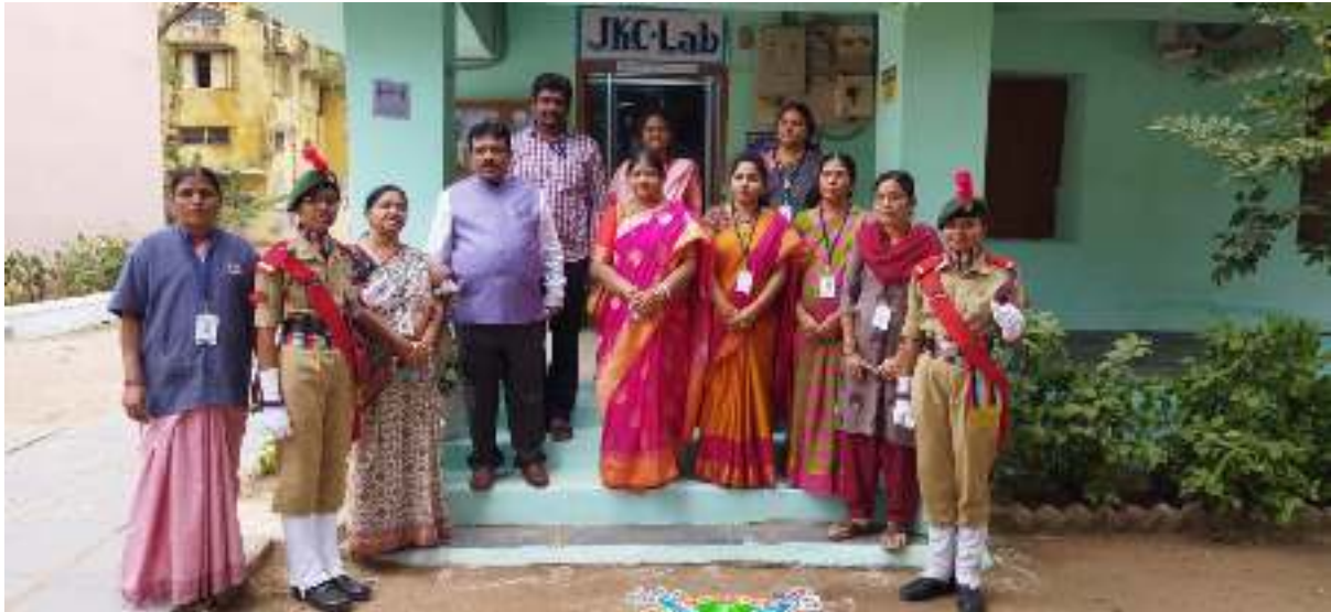
JKC Staff with Autonomous Committee Members